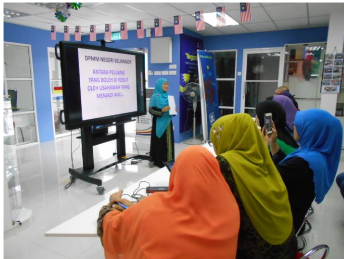
Sesi soal jawab antara penyampai serta peserta yang hadir