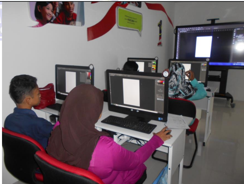
Caption : Masih lagi bersama ibunya mengikuti kelas asas kemahiran untuk penyuntingan gambar menggunakan Adobe Photoshop.